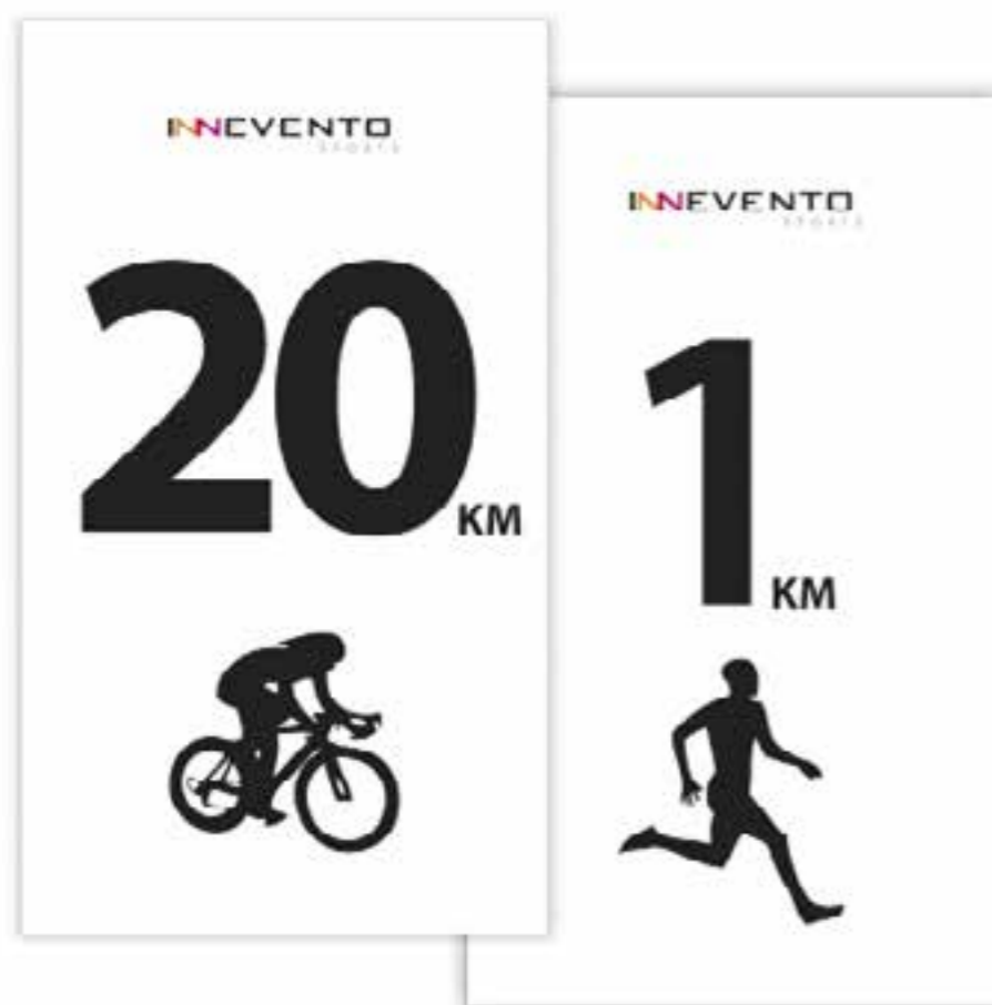
ejemplo puntos kilometricos half

>> La señalética propia del circuito de Half sera BLANCA. Puede haber algunas señales de color amarillo cuando se quiera resaltar algún punto.